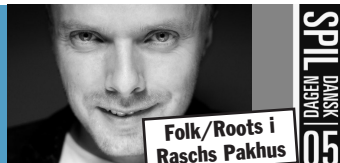
Folk/Roots i Raschs Pakhus