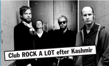
Club ROCK A LOT efter Kashmir

KASHMIR - Bandet, der gav 90'er-generationen stemme - er, gennem hårdt arbejde og en stribe albums, blevet et af de få bands, der har været med til at definere en generation og dens verdensoplevelse som en musikalsk epoke. Med 14 år på bagen er de fire herrer efterhånden garvede veteraner på den danske rockscene, men ikke desto mindre altid på ud-kig efter nye måder at forfine og videreudvikle deres raffinerede musikalske udtryk. Kashmir er et af vores få orkestre i verdensklasse og Kasper Eistrup en af vor bedste, hvis ikke den bedste, sangskriver overhovedet.