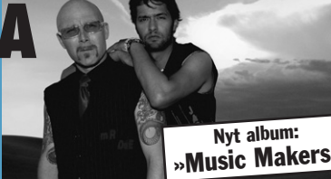
Nyt album: »Music Makers«